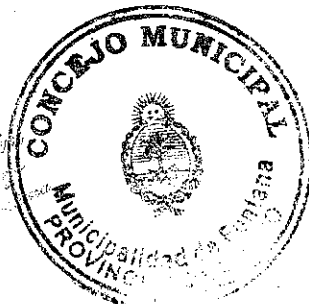
Rubén Osvaldo Avalos PRESIDENTE DEL CONCEJO Municipalidad de Fontana